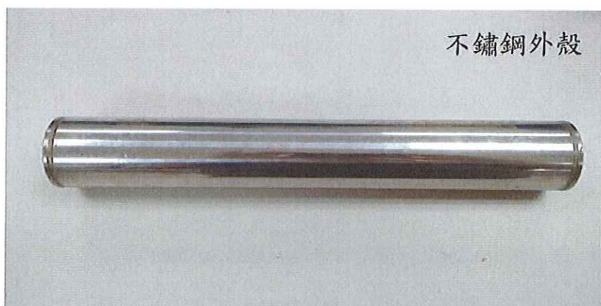
圖 2、遠紅外線省油器組成之包覆不鏽鋼外殼示意照