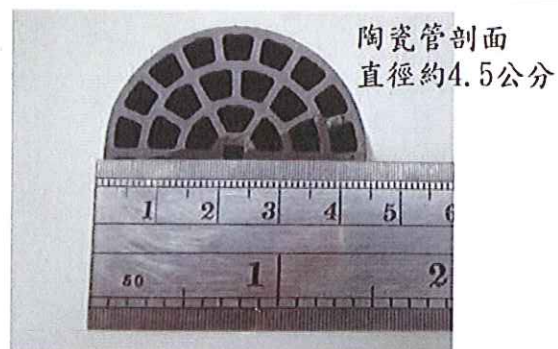
圖 1、遠紅外線省油器組成之陶瓷管